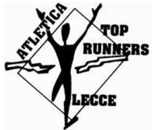
ASD TOP RUNNERS LECCE